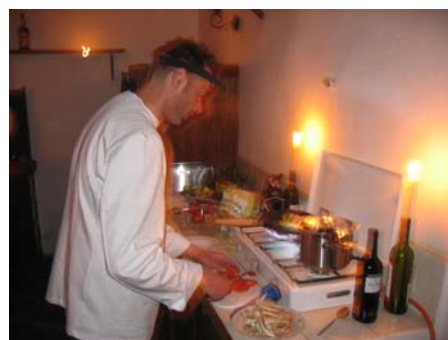
Oeps geen stroom, romantisch dineren bij kaarslicht!

Wij maken zoveel mogelijk gebruik van biologische producten uit de streek. Ook onze huiswijnen worden door lokale boeren geproduceerd. Daarnaast hebben we een aantal hele mooie wijnen op de wijnkaart staan waarvan het overgrote deel ook uit de streek komt.