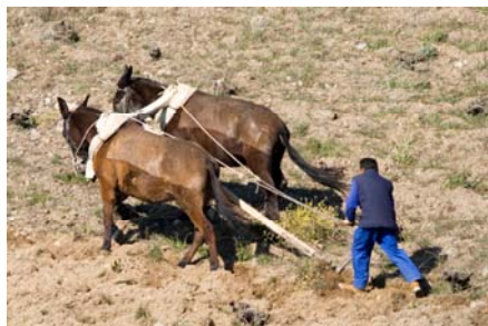
Ja, zo gaat het ploegen daar nog

Begin april was die vuurdoop: we hebben toen onze eerste gasten ontvangen. Ondanks dat we nog niet helemaal klaar waren met inrichten en het de koudste en natste periode in 50 jaar was, waren de reacties van onze 'proefkonijnen' erg enthousiast. Zie hieronder.