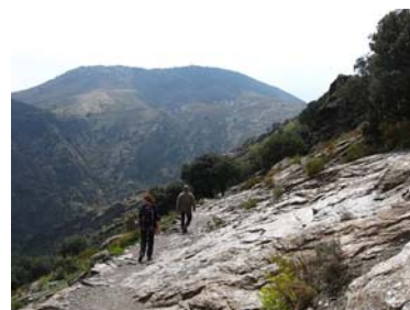
Op weg naar Murtas

De omgeving is prachtig om te wandelen met uitzichten over de vallei, de Sierra Nevada en de Middellandse zee. Vanaf de Cortijo kun je al beginnen met diverse wandelingen. Wil je een wat 'zwaardere' tocht maken dan zit je met een half uurtje rijden aan de voet van de Sierra Nevada in Bérchules, waar vandaan veel wandelroutes beginnen. Zo ook naar de drie hooggelegen bergdorpjes Pampaneira, Bubión en Capileira.