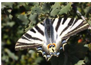
Pagesoort, gespot door Erik van Dijk

“Het was geweldig, Cádíar was verrassend levendig op zaterdagavond. Wij komen bij jullie wonen en nemen al onze dieren mee.”